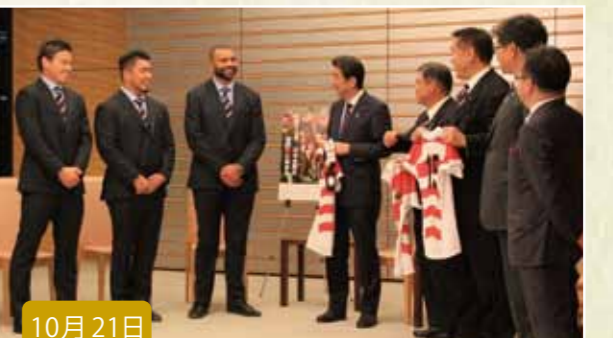
10月21日 ラグビー日本代表選手による安倍総理表敬に同席