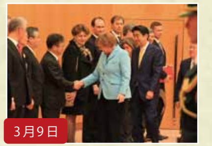
3月9日 日独首脳会議に同席