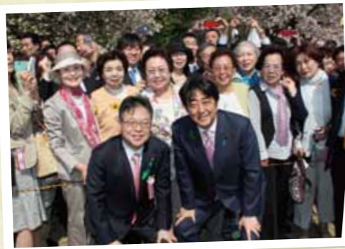
4月18日 『桜を見る会』にて 地元女性支援グループの皆さんと