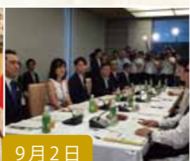
9月2日 伊勢志摩サミット・ ロゴマーク審査委員懇談会