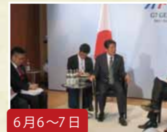
6月6~7日 安倍総理のウクライナ訪問、G7 サミットに随行