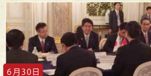
6月30日 日・メコン首脳会議に同席