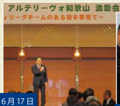
6月17日 アルテリーヴォ和歌山 激励会 サッカーチーム・アルテリーヴォ和歌山の JFL 昇格に向け激励