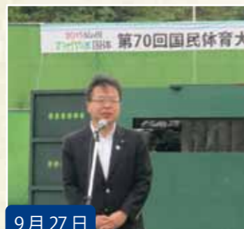
9月27日 『紀の国わかやま国体』 アーチェリー競技開会式