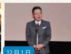
12月1日 ワールドプレミアにて、 日本政府代表として挨拶