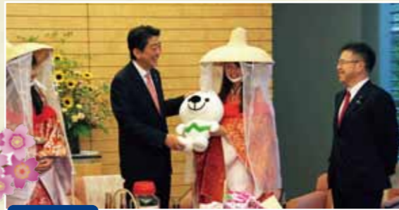
6月5日 平成27年『梅の日』梅娘の 安倍総理表敬に同席