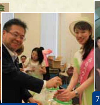
6月17日 梅振興議員連盟で梅酒づくりに参加