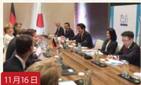
11月16日 総理のG20 出席、ロシア・プーチン大統領ほか各国首脳との会談に同席