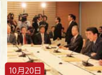
10月20日 国家戦略特区諮問会議