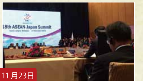
11月23日 総理のAPEC、ASEAN 関連首脳会議に同行