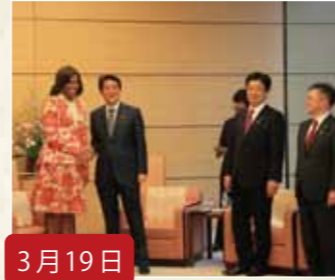
3月19日 米国大統領夫人の安倍総理表敬に同席