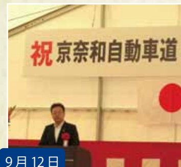
9月12日 京奈和自動車道の開通式典に出席