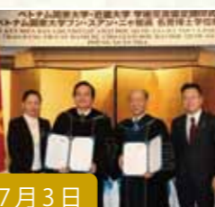
7月3日 ベトナム国家大学・ 近畿大学の学術交流協定調印式