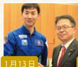
1月13日 油井宇宙飛行士を激励