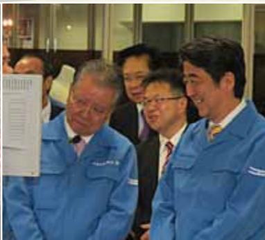
世界シェアNo.1の 地元コンピューター横編機メーカーを視察