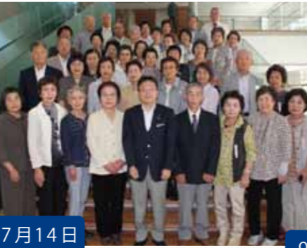
7月14日 和歌山県遺族連合会の 皆さんが表敬訪問