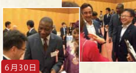
6月30日 在京イスラム諸国外交団との懇談