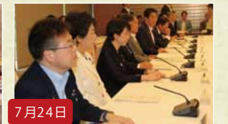
7月24日 東京オリンピック・パラリンピック競技大会推進本部