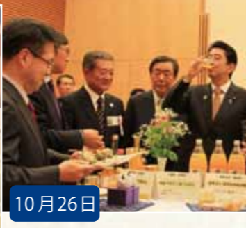
10月26日 地域活性化の優良事例 『ディスカバー農山漁村の宝』 に県内2社が選出