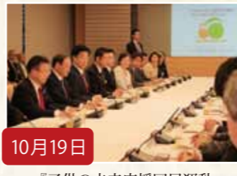
10月19日 『子供の未来応援国民運動』 発起人会議