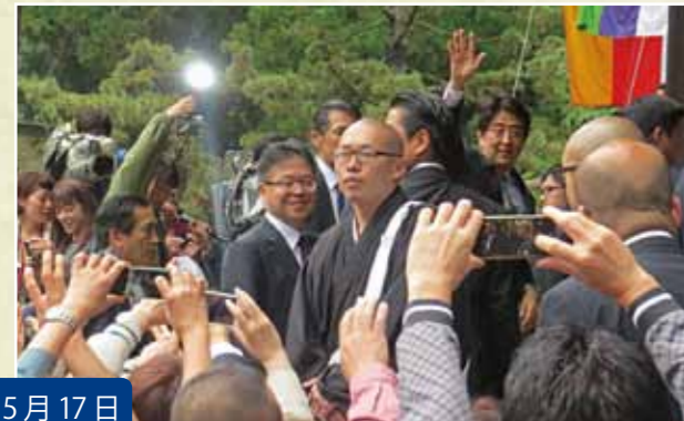
5月17日 安倍総理の高野山参拝に同行