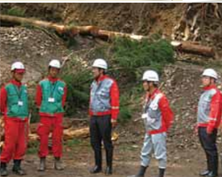
中辺路町間伐現場を視察