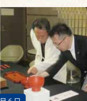
9月6日 伝統工芸品『根来寺根来塗』工房を視察