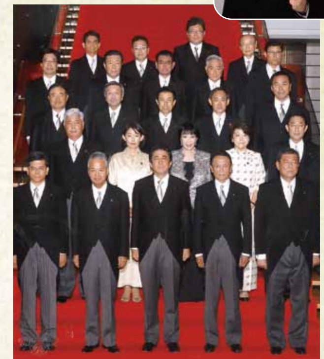
第3次安倍改造内閣で内閣官房副長官に再任