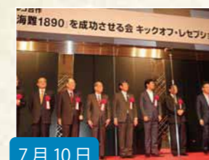
7月10日 成功させる会 『キックオフ・レセプション』

125 年前に和歌山県串本沖で起きたトルコの軍艦『エルトゥール号』の海難事故をきっかけに、日本とトルコの強い絆が結ばれた歴史を描いたこの映画は、2013 年 10 月に安倍総理とトルコのエルドアン首相との間で合作に合意して以来、和歌山県内やトルコ国内で撮影・制作され、12 月 5 日、ついに公開されました。