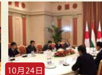
10月24日 総理に同行し、モンゴル及び中央アジアを訪問