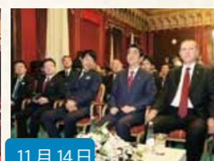
11月14日 トルコにて、日・トルコ両首脳と ダイジェスト版を鑑賞